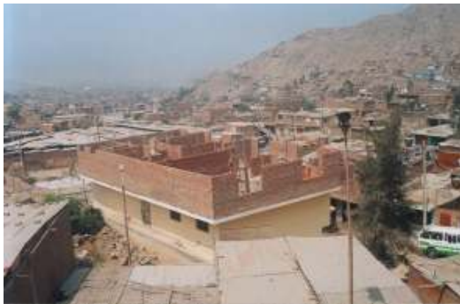
... und mit Dach auf dem 3. Stock (von hinten)